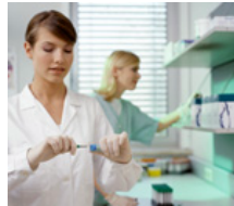
Clínicas / clínicas universitarias