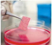
Ingeniería de tejidos biológicos