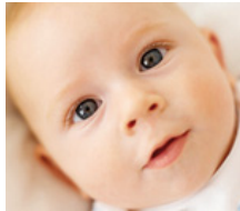
Fertilización in vitro