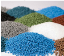
Industria del plástico