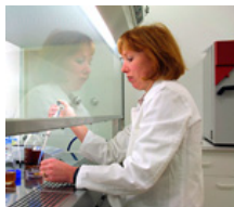
Investigación científica fundamental / institutos de investigación