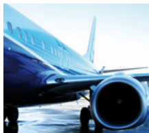
Industria aeroespacial, industria de defensa