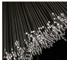
Industria del metal / construcción de maquinaria